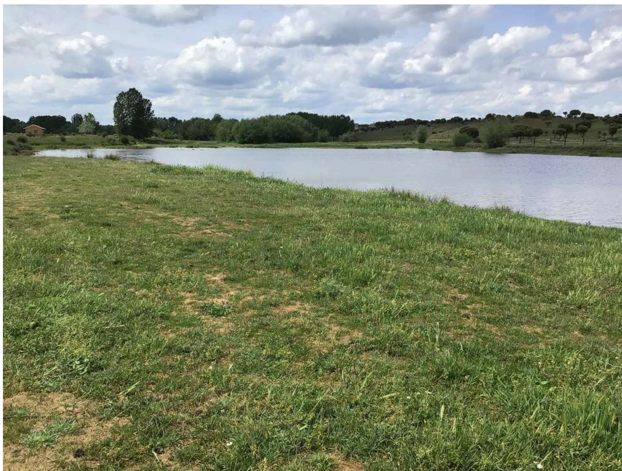
Paraje La Tabla Jiménez de Jamuz