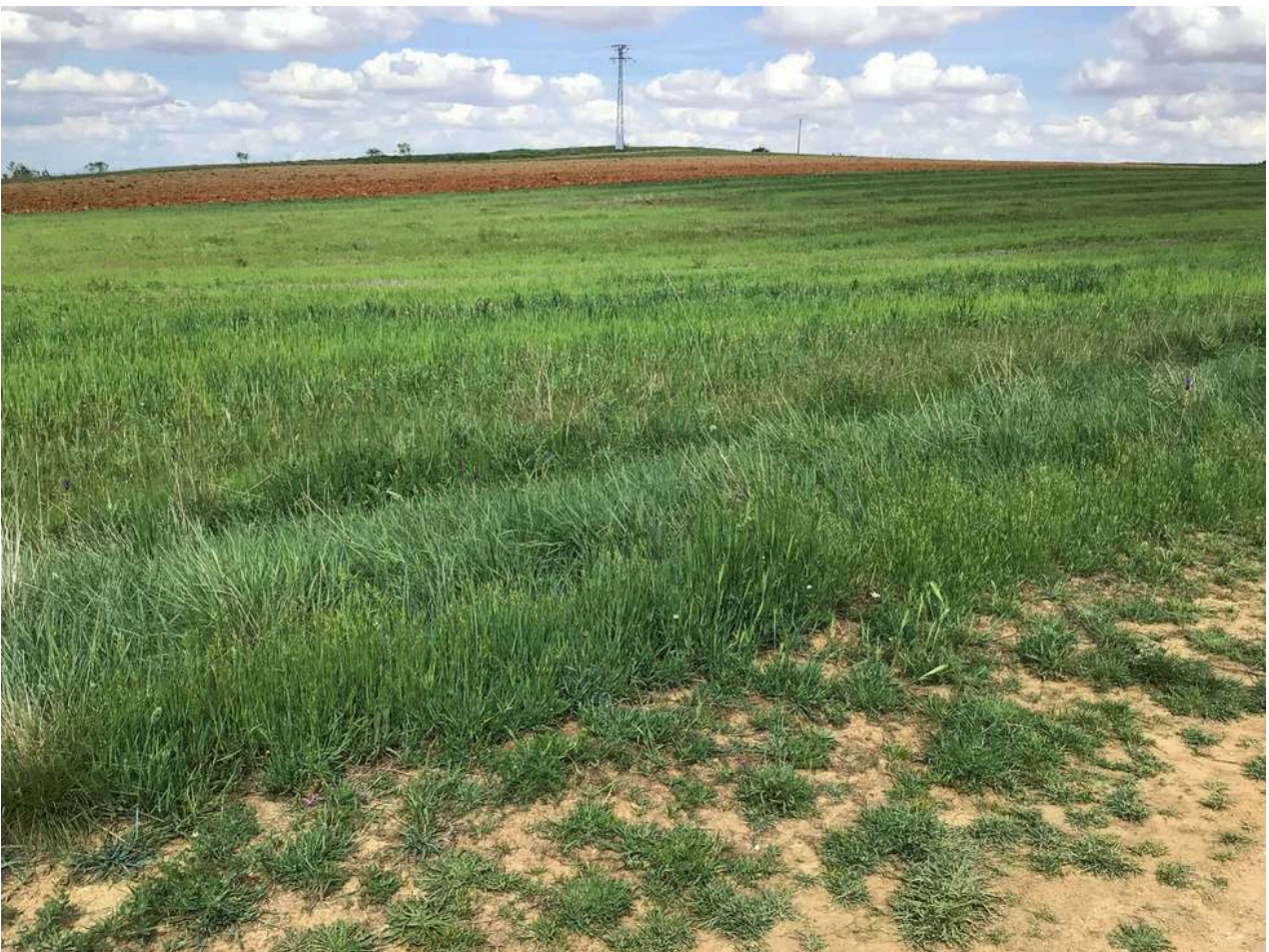
Paraje Las Cuestas Villanueva de Jamuz

En el caso de Jiménez, tras la concentración parcelaria, está dividido en 16 polígonos comprendidos entre el 201 al 216.